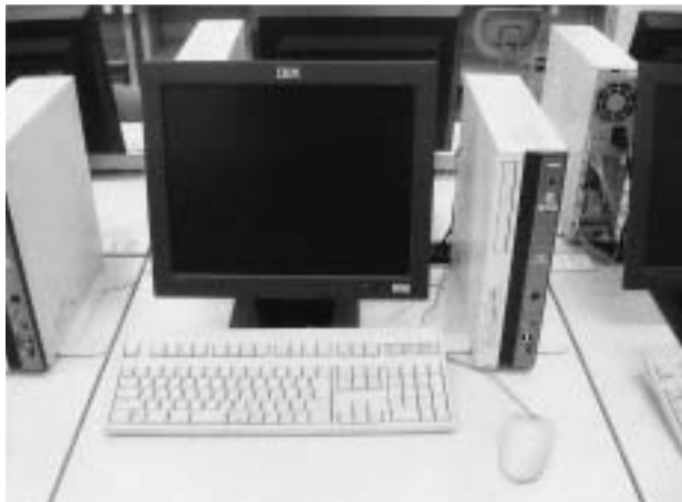
図1 情報教育ルームクライアントPC

情報教育ルーム（49台）はVID（Virtual Image Distributor）というハードディスクを搭載していないクライアントPCを導入し、サーバから集中管理している。それにより、ソフトウェアのインストール・アップデート等、様々なメンテナンスをマスターPC1台で安全・簡単に行う事を可能にした。隣室のマルチメディアルーム（22台）及び別棟の図書館（5台）に関しては、ハードディスクデータ保護装置〔商品名 Safety Pro・PCIカード〕を用いクライアントPC環境を管理している。