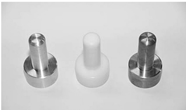
図2 組み立てた製品

ここまで加工した段階で、アルミ、真鍮、樹脂に関しては図2のように組み立てることができ、製品として問題はなかった。ウレタンについてはネジ部分の加